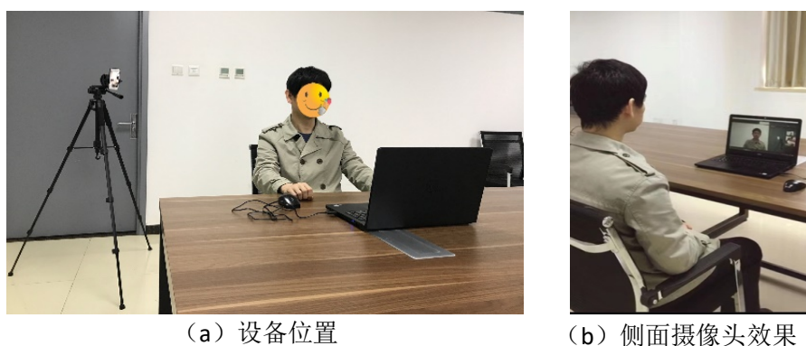
图 1 电脑+移动设备设置要求

6、登录腾讯会议后，一台设备从正面拍摄，保证考生头肩部及双手出现在视频画面正中间；另一部设备从考生后方成 45^{\circ} 侧面拍摄，保证考生头肩部、及第一台设备的全部屏幕出现在视频画面中，如图 1 或图 2 所示。为避免来电及手机闹钟干扰考核，建议正面拍摄设备使用电脑登录腾讯会议（如图 1 所示）。考生侧面的电子设备需关闭音频，以防产生回音。