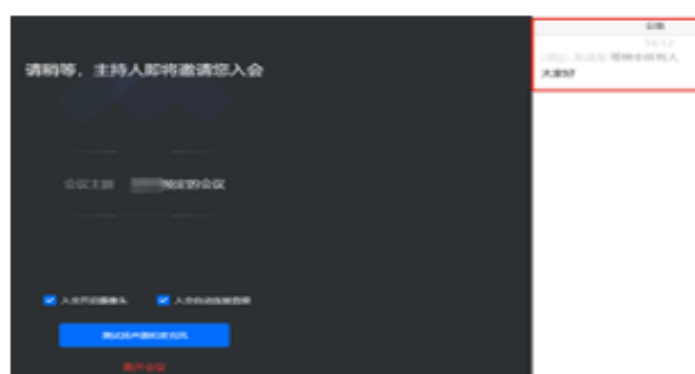
图3 腾讯会议电脑端界面

复试老师可通过公告对等候室的考生发布消息（如图3中红框部分），请及时关注。考生不能回复，也不能对复试老师发送消息。若没有消息通知，则公告部分不显示。